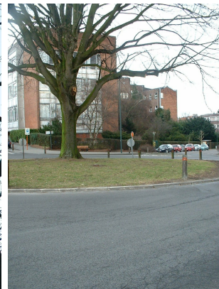
, 27 February 2006