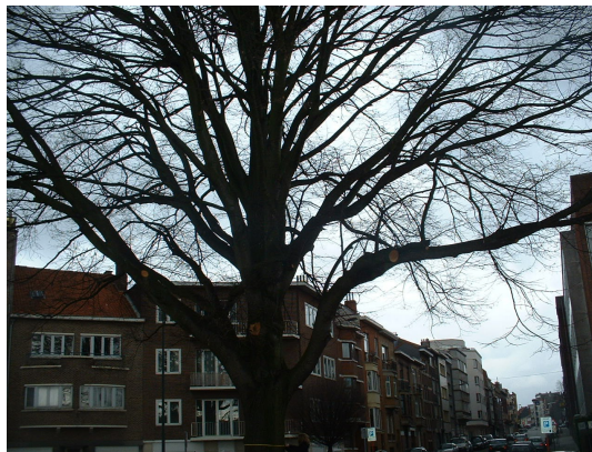
, 27 February 2006