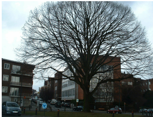
, 27 February 2006