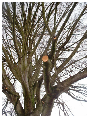
, 27 February 2006