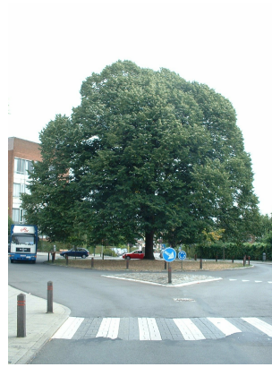
, 22 August 2003