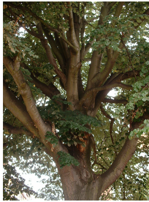
, 22 August 2003