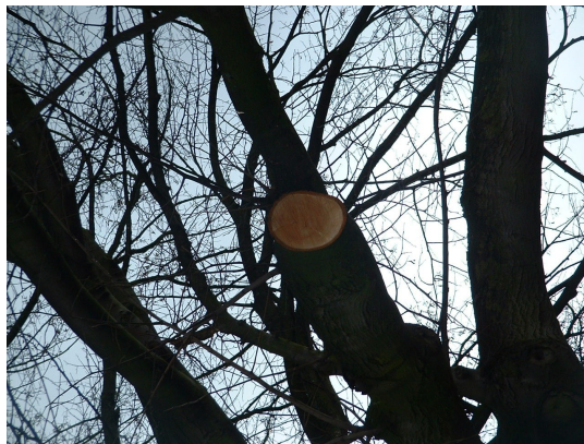
, 27 February 2006