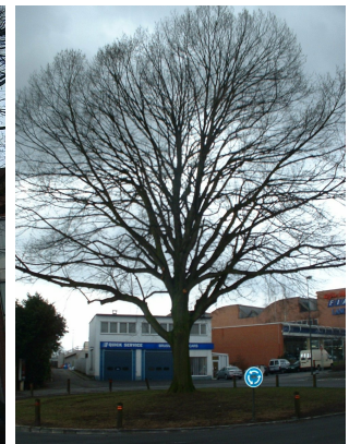
, 27 February 2006