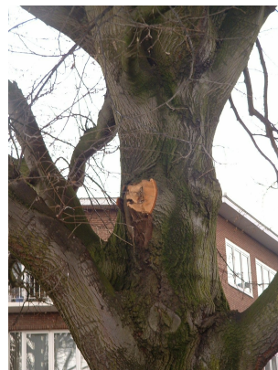
, 27 February 2006