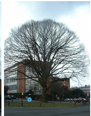
, 27 February 2006